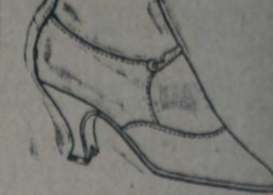
Art. 1899. Modelo de moda, cabritilla charolada y cabritilla color y negra. Precio de reclame. Nos. 34 al 41, $ 8.90.