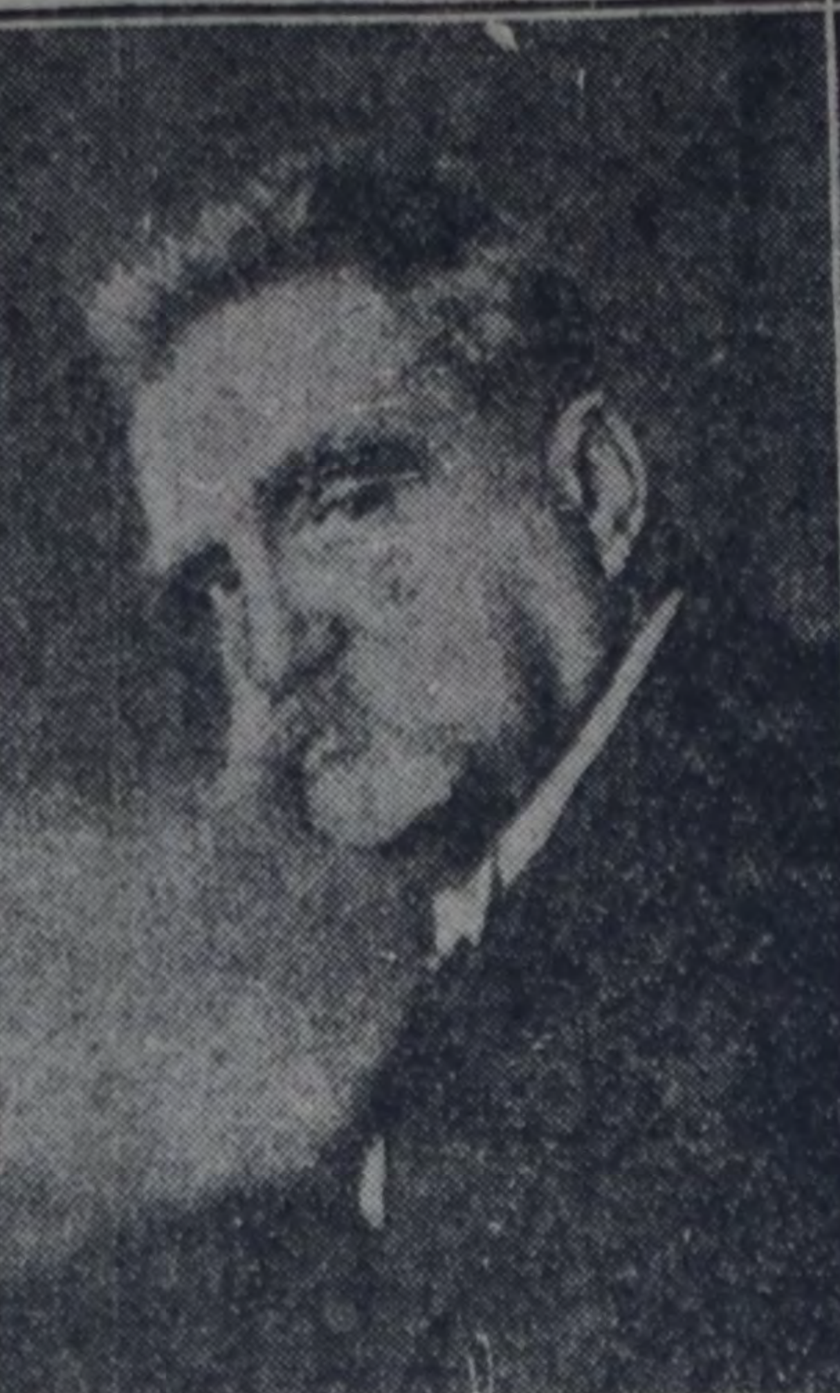
En la Conferencia internacional del trabajo reunida en julio último en Ginebra, a la que asistía como delegado del gobierno sueco, fué elegido por unanimidad presidente de la asamblea.

¿Sufrirán el presidente Alvear y el ministro Gallardo ese nuevo desafío? Si, constatarán por los precedentes, lo sufrirán con la cristiana mansuetudumbre que decoró su conducta. El Papa y sus satélites los han manoseado, se han burlado reiteradamente de sus