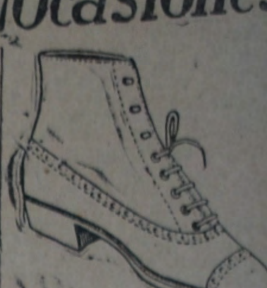
Art. 503. BOTIN DE BECCRO cosido, negro y de color. Nos. 33 al 45, a $ 7.50.