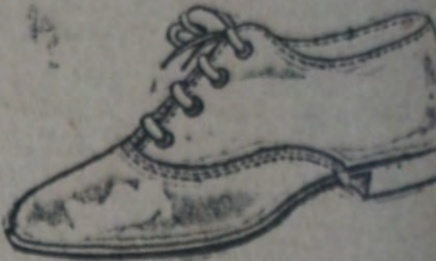
Art. 80. ZAPATOS de cabritilla cosidos. Tacto bajo como modelo y de una tira, para entresaca. Ocasión. Nos. 34 al 41, a $ 4.90.